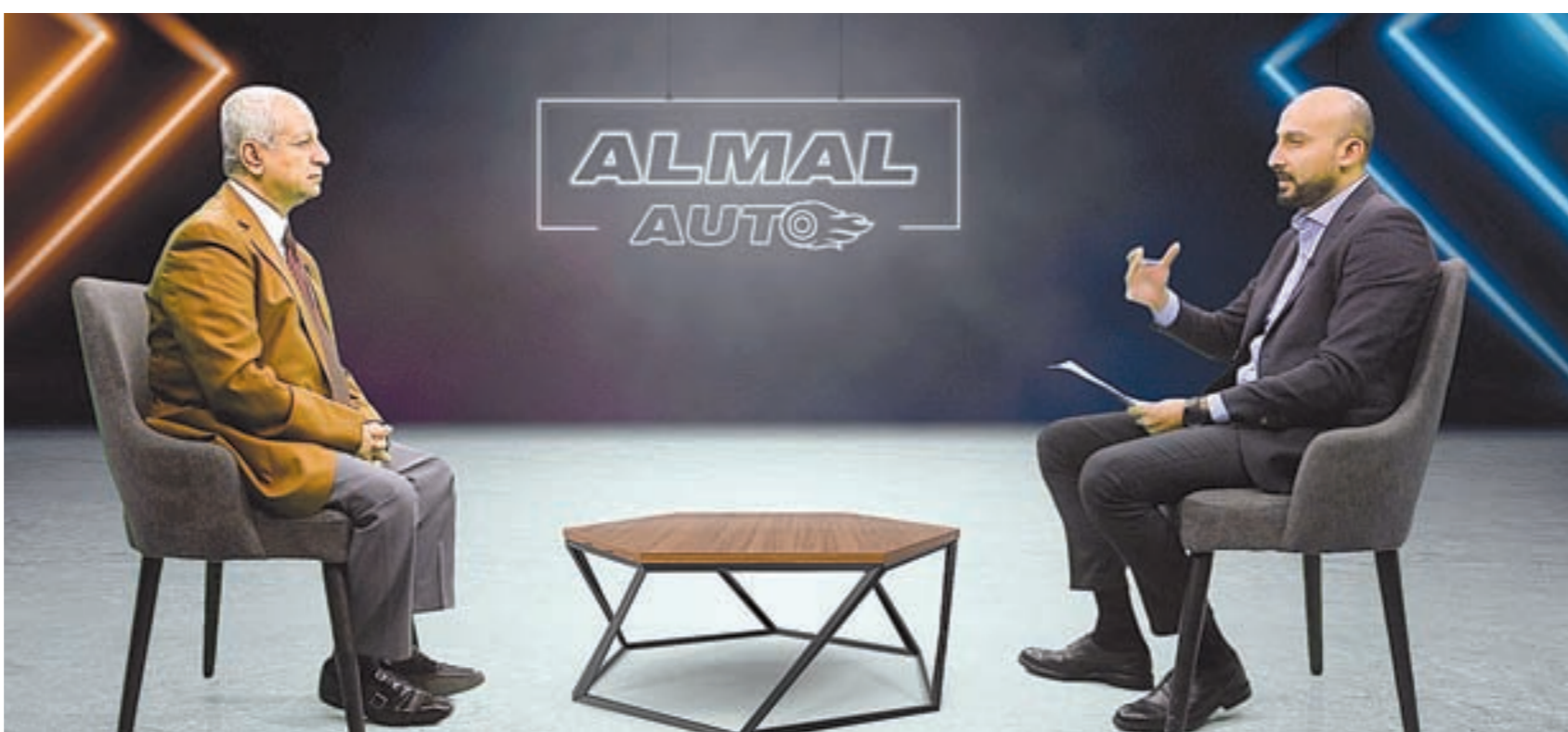
جمال عسكر في حوار مع «المال أوتو»

زيادات متوقعة مع تحريك «الجنيه» 30 - 40%